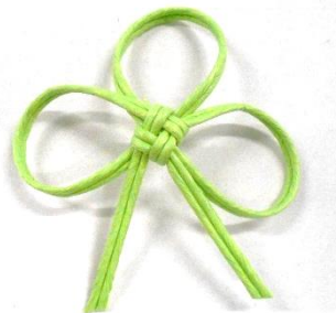
名札に付けている シトラスリボン