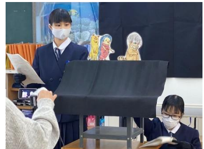
中学生ペープサート動画撮影風景