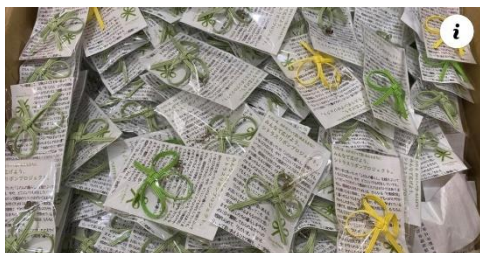
CITRUS-RIBBON.COM 大洲市立平野中学生の手づくりシトラスリボンをどうぞ

室長委員会・保健委員会・図書委員会・人権委員会の4つの委員会で、それぞれ責任を持って取り組みました。