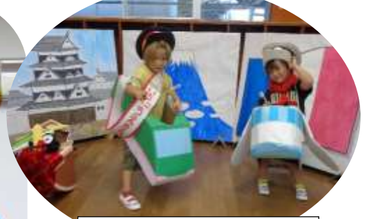
預り保育にて ハイポーズ！

＜こぼれ話＞親子ゲームのチームは、子供たちが考えて決めました。「ちいかわのうさぎちーむ」と「スプラトゥーンちーむ」です。好きなキャラクターやゲームから考えたそうです。